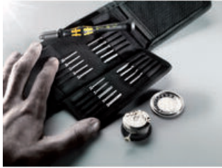
Kraftform Micro ESD Bits-Handhalter