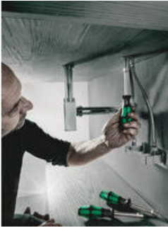
Hohlschaft für überstehende Gewindestangen