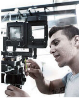
Mit Haltefunktion für Innen TORX® Schrauben