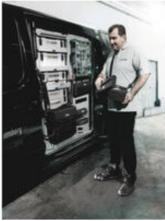
Wera 2go 1 - Der Dranpacker