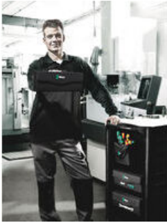
Wera 2go 3 - Der Drinpacker