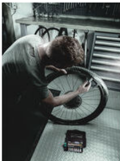
Bicycle Set 3