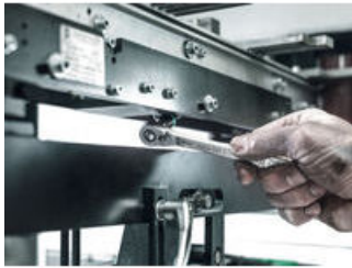
Zyklus Metal Switch

Aufgrund der immer enger werdenden Arbeitsbereiche wird es auch für Knarren immer enger. Dieses Problem hat Wera gelöst. Daher haben sich unsere Produktentwickler besonders intensiv in enge Arbeitssituationen eingedacht. Herausgekommen ist die extrem schlanke und robuste Knarre Zyklus Metal mit langem Hebel. Wenn der Richtungswechsel schnell gehen soll, ist die Knarre Zyklus Metal Switch das richtige Werkzeug.