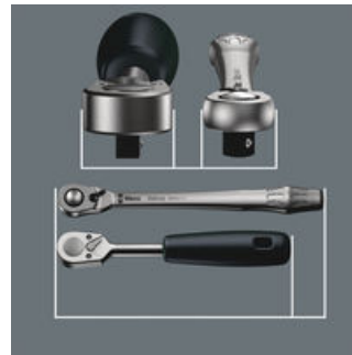
Zyklus Metal Switch

Extrem schlank. Langer Hebel. Geschmiedete Vollmetallknarre aus Chrom-Molybdän.