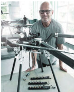
Die Wera Belts