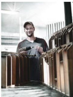
Bity se sníženým průměrem dříku