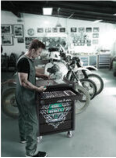
Exkluzivní dílenský vozík v designu Tool Rebel