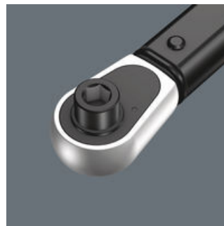
S přípojovacím rozměrem 1/4" pro šestihran.