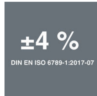
Přesnost činí ±4 % podle normy DIN EN ISO 6789-1:2017-07.