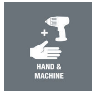
Hlavice (takzvané ořechy nebo také oříšky) HAND & MACHINE umožňují ruční i strojní nasazení. Pro obě aplikace tak stačí jeden sortiment.