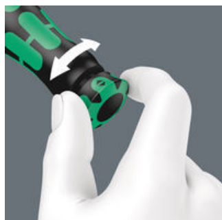
Se slyšitelným a viditelným zaskočením při dosažení hodnot na stupnici.