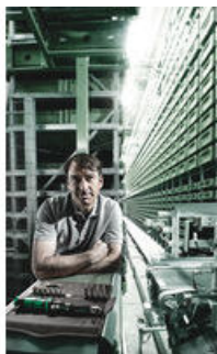
Sada momentových klíčů Click-Torque 1/4" s dvojitým kliknutím