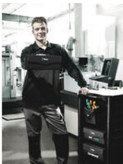
Wera 2go 3 - Taška na nářadí