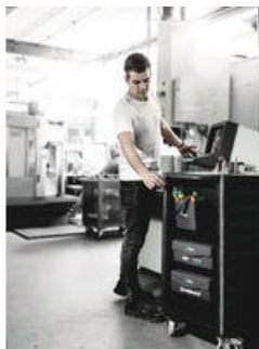
Wera 2go 4 Kapsa na nářadí