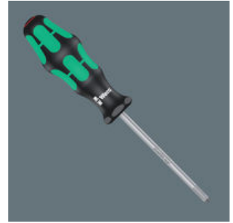
Kraftform 增强型 - 300 系列

Kraftform 增强型螺丝刀：掌中的人体工程学。它可以缓解手部劳损，在高强度的使用情况下效果尤为明显。配合 Lasertip 激光蚀刻刀头等其他技术和产品优势，Kraftform 螺丝刀是手动拆装螺丝的理想选择。