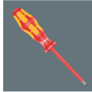
Kraftform 增强型 - 100 系列 VDE 绝缘螺丝刀

我们的螺丝刀会在水浴中进行10,000伏绝缘强度测试，以验证其重要的绝缘特性。维拉的每一把VDE绝缘螺丝刀都经过这样的测试，确保其在1,000伏的环境下能安全工作。