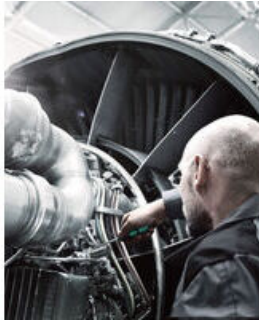
Kraftform 增强型 - 900 系列

Kraftform 增强型螺丝刀：掌中的人体工程学。它可以缓解手部劳损，在高强度的使用情况下效果尤为明显。配合 Lasertip 激光蚀刻刀头等其他技术和产品优势，Kraftform 螺丝刀是手动拆装螺丝的理想选择。