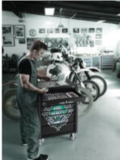
Tool Rebel 设计中的专用车间手推车