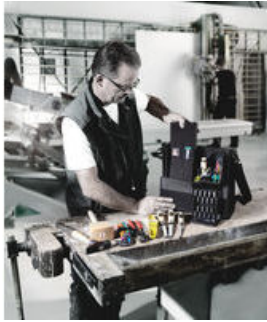
Wera 2go 2 - 外部粘贴、内部（粘贴）收纳