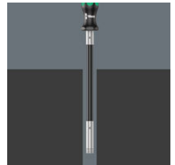
薄型批头固定器 393 S

使用393 S 螺丝刀, 可随时随地进行旋拧操作。采用活动轴身设计, 可在不方便操作的位置固定螺钉。适用于在难以到达位置进行旋拧操作的理想工具。