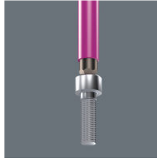
L型内六角扳手附固持功能

扳手长端上的球锁使得螺丝能够被紧紧卡住, 固持功能则在只能单手操作的狭窄和尴尬空间内特别有效。