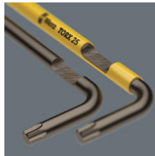
L 型扳手 SPKL

SPKL, 保护手指! 带热塑塑料护套的L型扳手 (SPKL) 用握持舒适的圆形材料制成, 在低温环境下也能确保工作安全舒适。经过特殊的激光表面处理过的材质具有抗腐蚀性。颜色识别标识和印记方便找到需要的L型扳手。