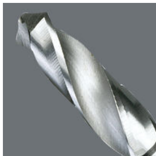
用于木质材料的麻花钻

用于木质材料的麻花钻应用： • 1/4"驱动适用于符合DIN 3126-D 6.3 (ISO 1173) 标准的夹具 • 六角轴可传递极高扭矩 • HSS=高速钢 • 经过精调的材料富有弹性，使用寿命更长 • 同心度极佳 • 经过回火处理的缓冲吸收型批头，使用寿命超长