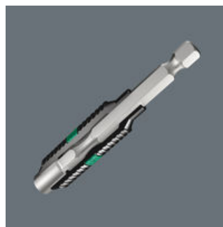
双重抗扭快速接杆

维拉双重抗扭夹具采用了扭力弹簧设计, 可吸收螺丝拆装作业期间产生的较小峰值载荷。配合带有扭力区的双重抗扭批头使用时, 可显著延长工具的使用寿命。维拉的双重抗扭夹具也可方便地用在传统批头上。