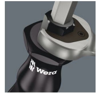
一体式六角加力螺栓

优质钢材制成的六角形刀杆贯穿整个手柄，使得用手锤击打的力量也能安全无损地传递。整体回火的材质处理保证刀杆不会碎裂或者折断。