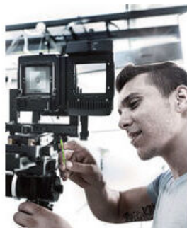
TORX®梅花螺丝固持功能