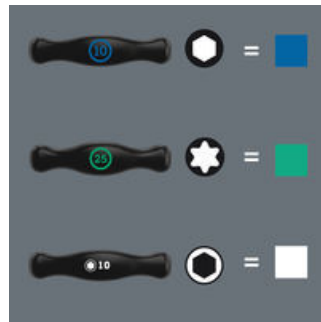
螺丝刀带Take it easy易寻色标系统

螺丝刀，应用 Take it easy Tool Finder系统：根据牙型进行颜色编码，配合尺寸压印标记。