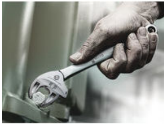
Joker 6004: 自动连续自定位