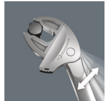
Joker 6004: 快速工作的棘轮机构

Joker 6004平行的光滑颚口因其表面压力, 能避免在传输扭力时螺帽和螺栓棱角因磨损而变形。