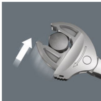
Joker 6004: 自动连续自定位

Joker 6004开口扳手, 带自动调节大小并夹紧的平行双颚口, 可取代所有标定尺寸内的开口扳手。