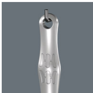
Joker 6004: 实用挂孔