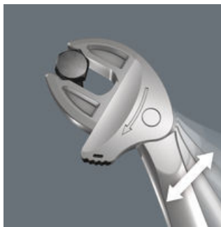
Joker 6004: 快速工作的棘轮机构

Joker 6004平行的光滑颚口因其表面压力, 能避免在传输扭力时螺帽和螺栓棱角因磨损而变形。