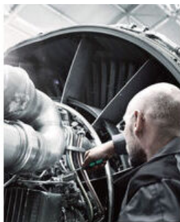
Lasertip激光蚀刻刀头有效防止打滑

Kraftform 增强型螺丝刀: 掌中的人体工程学。它可以缓解手部劳损, 在高强度的使用情况下效果尤为明显。配合 Lasertip 激光蚀刻刀头等其他技术和产品优势, Kraftform 螺丝刀是手动拆装螺丝的理想选择。