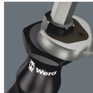
Hexagonal blade and bolster

Hexagonal blade and bolster for higher torque transfer