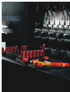
电工用 Zyklop 棘轮和配件