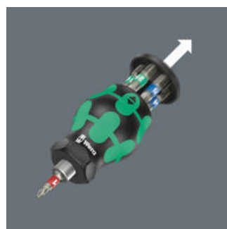
带集成式钻头库的手柄

凭借其紧凑的手柄形状和短刀杆，Kraftform 短柄特别适合空间有限的拧紧作业。